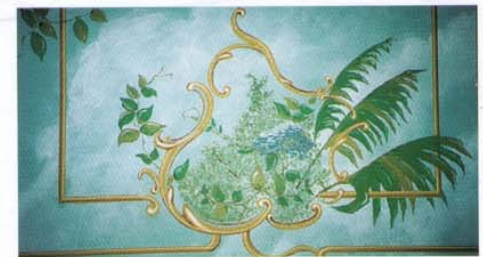
Restoration einer Jugendstil-Decke in Leipzig, Brandiser Straße 2.