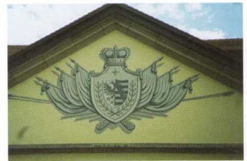
Illusionsmalerei am Giebel des Rathauses Bernburg. Das ehemals in Stuck ausgeführte Wappen wurde als Malerei mit räumlicher Wirkung erneuert.

zahlreichen Farbschichten späterer Generationen. Die Spezialisten der Firma Heindorf erkunden die einstigen Maltechniken, verwendete Materialien u.a.m., um darauf ihre akribische Restaurationsarbeit aufbauen zu können.