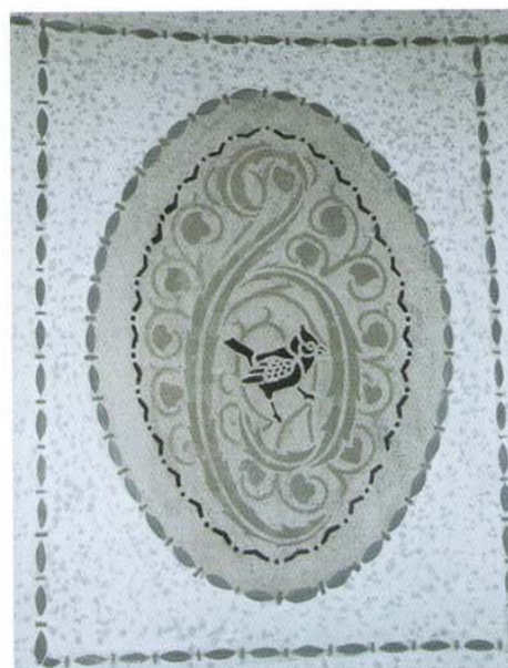
Restoration der gesamten Wandornamentik im Treppenhaus Rückertstraße 14, Detailsicht.