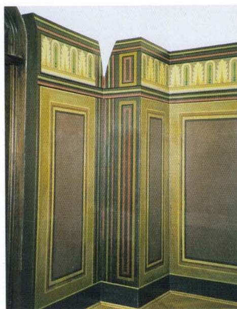
Restoration/Rekonstruktion der ursprünglichen Sockelgestaltung im Gastraum des Ratskellers Leipzig.