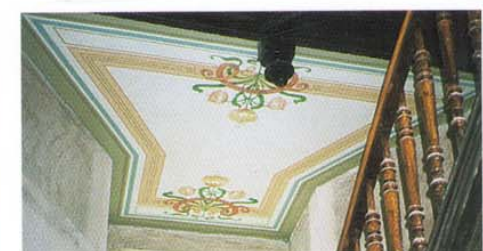
Malerei an einer Podestdecke in einem Leipziger Wohnhaus (ausgeführt in Silikattechnik).

MALERFACHBETRIEB Wolf-Christian Heindorf