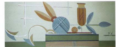
Restoration/Rekonstruktion eines Treppenhauses in der Heinrich-Budde-Straße 15. Ansicht: Detail der Supraporten.